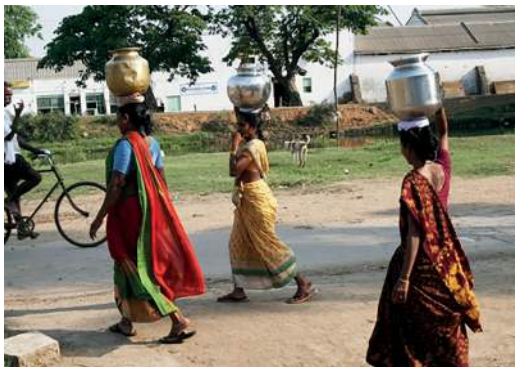
Figura 10: Forma tradicional de transportar agua

Una forma de mejorar el acceso al agua fue el carrito transportador, fabricado con materiales de la zona fáciles de obtener. IDEO colaboró con artesanos locales para modelar varias opciones de diseño, como se puede ver en las figuras 11 y 12 .