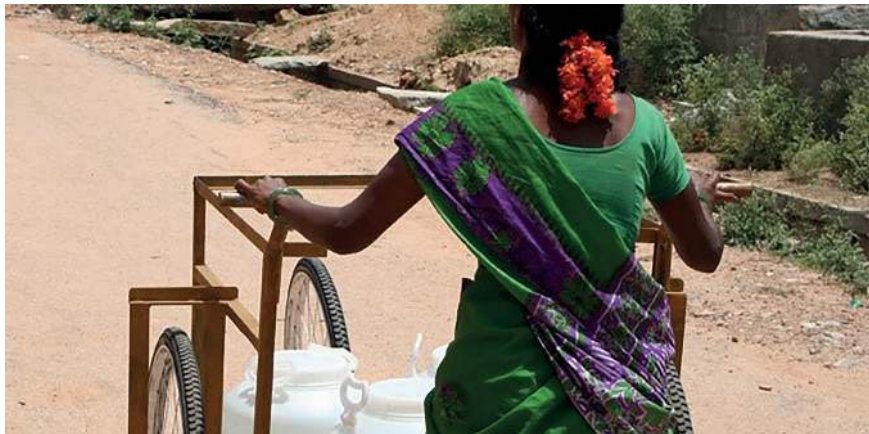
Figura 12: Carrito para transportar agua de IDEO