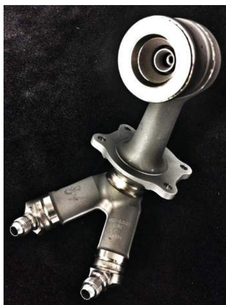
Figura 4: Boquilla de combustible de un motor LEAP impresa en 3D