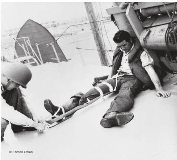
Figura 7: Férula Eames en uso