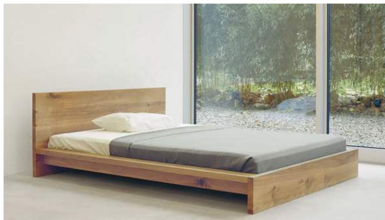
Figura 6: cama Mo SL02 de e15