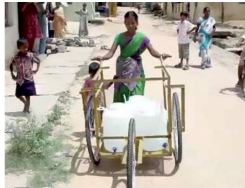
Figura 11: Carrito para transportar agua de IDEO