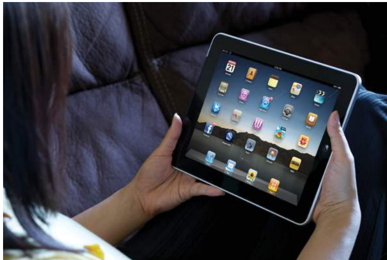
Figura 9: Apple iPad

El iPad se calificó como competidor de los computadores portátiles y fue el primer producto de su clase en difundirse en el mercado. Aunque el iPad es un producto relativamente nuevo, ya se reconoce como un diseño clásico.