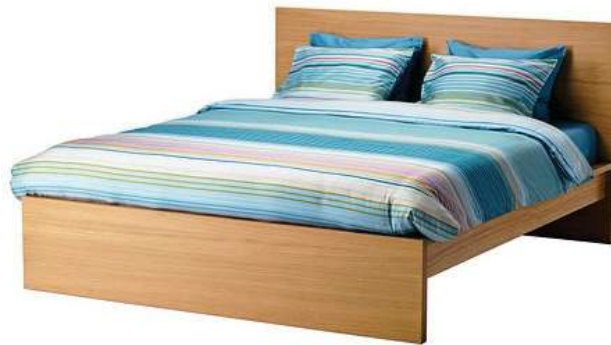
Figura 5: Cama Malm de IKEA