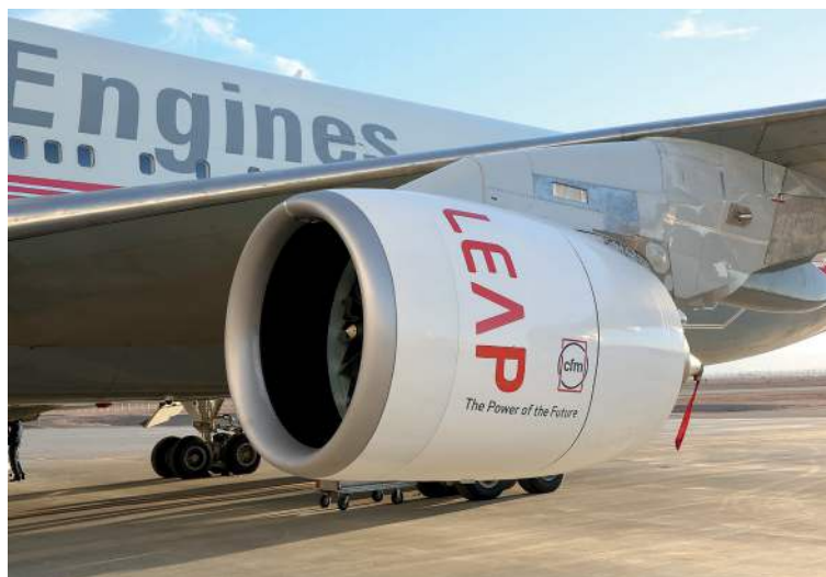
Figura 3: Motor LEAP

La serie LEAP de motores para aeronaves, véase la Figura 3 , es la primera que contiene componentes impresos en 3D, véase la Figura 4 . También es la primera en recibir una certificación tanto por parte de la Administración Federal de Aviación como por la Agencia Europea de Seguridad Aérea.